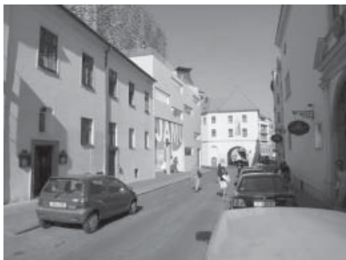
— Studie vítězného návrhu —