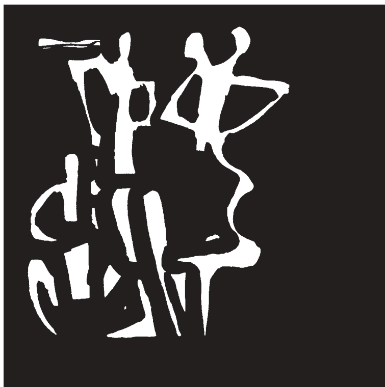
— Kresba Libor Fára —

kem. Když člověk slyšel, co lze na marimbě předvést, když se paliček uchopil někdo jako Katarzyna Myčka, mohl trochu propadnout pocitu beznaděje, že tohle on nedokáže. Ale to je přirozené, že o sobě pochybujeme. Hlavní však je, aby mladý muzikant neztratil chuť se zlepšovat, touhu překonat sebe sama a vstřebávat vjemy okolí a především, aby přemýšlel optimisticky a šel za svým vytouženým cílem. K tomu je bezesporu třeba, aby existovaly osobnosti, které mladého umělce na tu klikatou cestu navedou, předají mu své zkušenosti a tzv. ho nakopnou do života. A právě takovou osobností byla na pár dní pro studenty bicích nástrojů a všechny zúčastněné paní Katarzyna Myčka. Její kurzy nebyly totiž přínosné pouze hudebně, ale také lidsky. Na závěr totiž hovořila nejen o marimbě, ale o životě samotném. A každý si určitě kus z ní odnesl s sebou. Já sama jsem byla unesena každou minutou semináře a to nejsem hudebník. Ale tak mě to vtáhlo, jako bych najednou byla v jiném světě. Spojí-li se totiž ve hře perfektní technika, jistota a absolutní připravenost s hudební inteligencí, a to vše je navíc