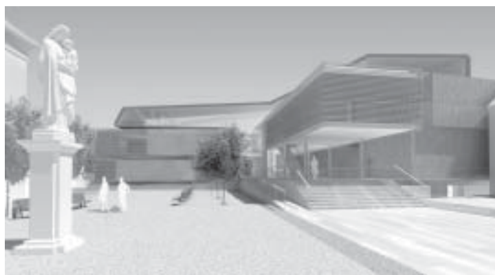
— Studie návrhu odměněného 2. cenou —