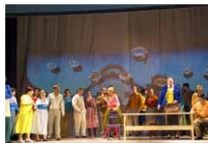
Operní představení Prodaná nevěsta