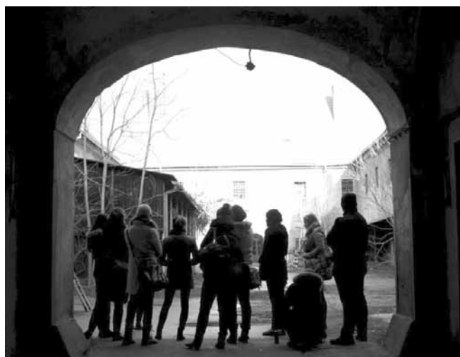
— Snímek ze setkání studentů uměleckého manažerství ČR a SR, které pořádala DIFA JAMU —