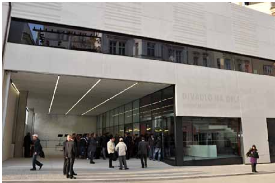
— Divadlo na Orlí hraje už druhou sezonu —

V každé laboratoři občas praskne zkumavka, nebo se ukáže, že předpokládaný postup nevede k cíli. Může se to stát i v laboratoři hudebně-dramatické: ne všechno se musí povést na sto procent. A navíc – ne všechno musí být všem srozumitelné a pro všechny přijatelné. Bývá totiž v povaze experimentu, včetně experimentu uměleckého, že jde svými cestami a snaží se objevit něco nového. Jen namátkou připomeňme, že v Divadle na Orlí o to usilovala třeba Prodaná nevěsta (Smetanova první verze s činoherními scénami) či nedávná inscenace náročné Mozartovy opery Don Giovanni, nebo muzikálová verze Bohéma či vysoce kontroverzní anglický muzikál Jerry Springer: Opera, který formou provokace přesahující hranici u nás obvyklou přináší ostrou kritiku zvrácené televizní zábavy, která pozvolna zaplavuje i naše krajiny... Někteří kritikové a diváci výše uvedená díla nebo i další produkce Divadla na Orlí přijali, jiní je podrobili silné, mnohdy zdrcující kritice. To je však normální v každém divadle.