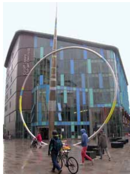
— Centrální knihovna v Cardiffu, ve které probíhal výzkum ohlasu projektu

Stejně jako v historii Divadla Husa na provázku patří i v dějinách Cardiff Laboratory Theatre projektu „Together“ podstatné místo, což odráží i množství archivních materiálů, které se v centru dochovalo a jež byly pro chystanou publikaci nalezeny a nařceny. I ve vzpomínkách řady jeho členů se projekt uchoval v ostrých konturách. Účastníci akce, na níž se podílelo osmdesát umělců a dvacetihlavý podpůrný štáb, vzpomínali na sugestivní prostory opuštěné tovární haly v Kodani, v níž se hrálo pro pět set diváků dvakrát denně. Vybavovali si komunní způsob života, společnou péči o sdílené prostory, fyzickou práci na úpravě továrny pro divadelní účely, přespávání v maringotkách i společné debaty a zpěv národních písní ve volných chvílích. Politickou dimenzi projektu, který se konal dva roky před začátkem sovětské „perestrojky“, vnímali někteří členové CLT ostře, samotný akt spolčení souborů ze Západu i Východu