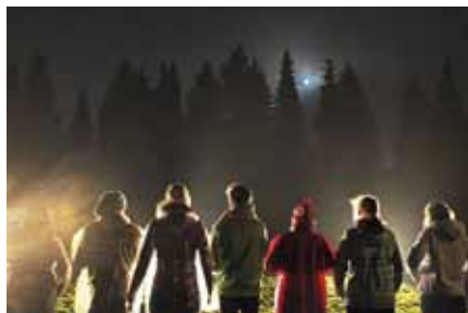
Obnova lidových tradic