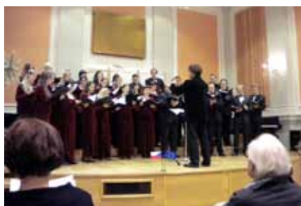
Koncert soudobé hudby