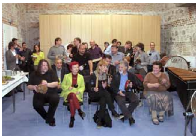
Hudební fakulta JAMU na podzim roku 2013 otevřela krásně zrekonstruované sklepní prostory, ve kterých vzniklo pět nových učeben. V největší z nich, patřící katedře bicích nástrojů, si hosté slavnostního otevření při jedné skladbě sami zahráli na malé bicí nástroje