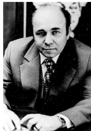
— Dirigent Zdeněk Košler —