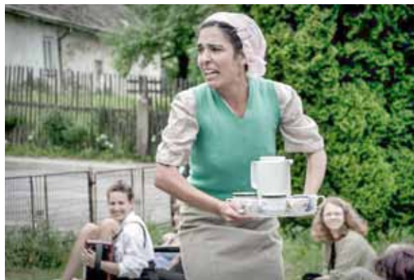
— Pilar (Rebeca Izquierdo) roznášející publiku kávu — si stěžuje, že nikdo z diváků neumí španělsky

Během zahajovacího divadelního setkání nazvaného Velkolhotecký otvírák (koncept: Vítězslav Větrovec, režie: Marika Smreková) uvedeného v pátek 21. června „za vrškem“ (palouk v lese kousek nad Velkou Lhotou směrem k osadě Poldovka) se jednotliví zahraniční studenti velkolhoteckému publiku představovali krátkými divadelními, pěveckými či hudebními výstupy, které se úzce vázaly k místu jejich rodiště. Ceremoniál začínal ukázkami z tradiční turecké lidové svatby,