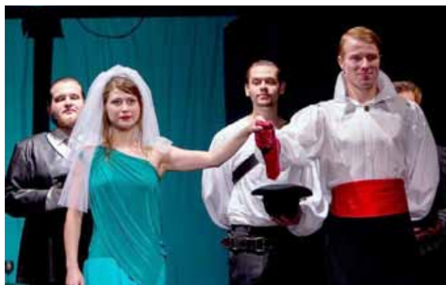
— Záběr z inscenace Hamlet —