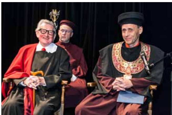
Doctor honoris causa. Dalším v řadě čestných doktorů JAMU se stal významný filmový režisér Vojtěch Jasný. Slavnostní akt se uskutečnil v Divadle na Orlí