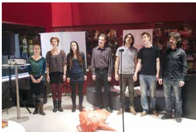
Přípravy 24. ročníku mezinárodního festivalu divadelních škol SETKÁNÍ/ENCOUNTER 2014 zahájil společenský večer v Divadle na Orlí. Součástí programu bylo i vystoupení studentů muzikálového herectví