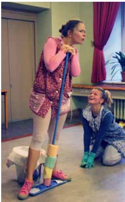
Záběr z představení Velký úklid v Helsinkách