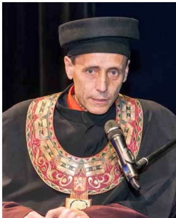
— Rektor JAMU se slavnostním rektorským límcem —

Kvalita se u vysokých škol skloňuje ve všech možných pádech už pár let, ale přesto ji nevnímám jako devalvovaný pojem. Abychom udrželi umění uměním, založeným na tom, že někdo něco v této oblasti opravdu umí, a odlišili je od zábavy, potřebujeme stále zvyšovat kvalitu naší práce. Ale kvalitu potřebujeme i proto, abychom byli jako škola konkurenceschopní v evropském prostoru uměleckých vysokých škol. Proto je třeba nastavit a korigovat procesy řízení kvality na vysoké odborné úrovni, proto potřebujeme i kolektivní orgán složený ze zástupců fakult, rektorátu i nezávislých auditorů, který bude nejen hodnotit výsledky, ale i odborně a fundovaně hledat strategie a cesty pro jejich dosahování na všech třech stupních – na úrovni vstupu, procesu výuky i evaluace výsledků.