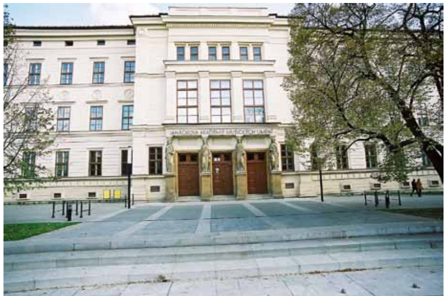
— Jubilující budova HF JAMU —