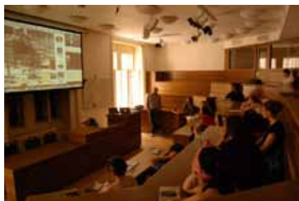
— Workshop s Borisem Kudličkou —

Dne 29. 10. 2012 se pro studenty Ateliéru Rozhlasová a televizní dramaturgie a scenáristika uskutečnil seminář na téma Současná evropská rozhlasová hra pod vedením dramaturga, scenáristy a vedoucího literárně-dramatické redakce Českého rozhlasu Hynka Pekárka. V listopadu se konal