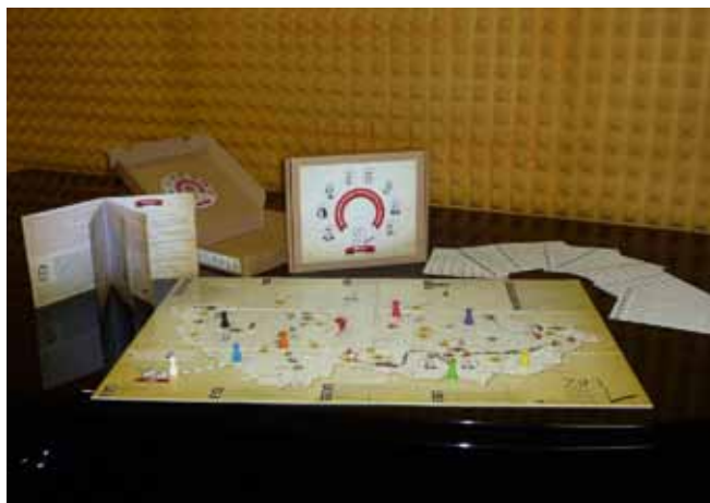
— K hudebnímu nosiči vznikla i desková hra na bázi Člověče, nezlob se , zanesená do mapy České republiky