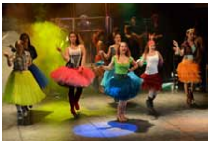
— Záběr z inscenace FOOTLOOSE/ TANEC NENÍ ZLOČIN