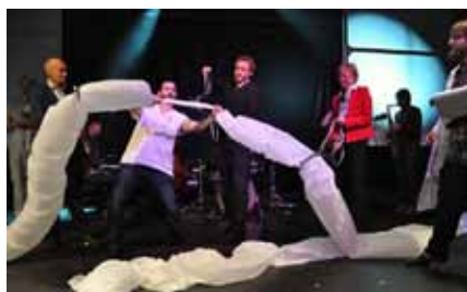
Otevírací ceremoniál nabídl originální program se střiháním pomyslné pupeční šňůry