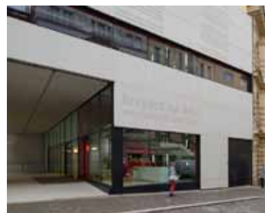
— Budova Divadla na Orlí —