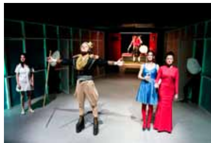
— Z inscenace Vaše bolest naše potěšení