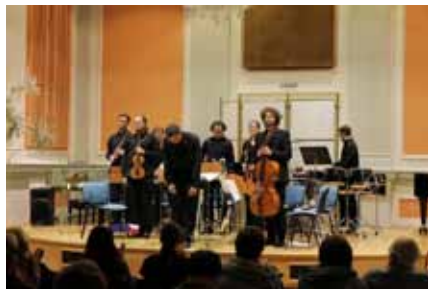
— Koncert soudobé hudby 12. 12. 2012 —

inscenaci Triumf citovosti (J. W. Goethe). Tato inscenace splňovala kritéria vymezená v rámci klíčové aktivity č. 4 a stala se tedy inscenací zájezdovou. Studenti i celý inscenační tým měli možnost vycestovat na několik zájezdů mimo domovskou scénu Marty, osvojit si adaptaci v jiném divadelním prostoru a prostředí a setkat se s inscenačními týmy mimobrněnských scén. V listopadu 2012 studenti absolvovali zájezd do Vídně, v lednu 2013 to byla Praha (Divadlo DISK), Zlín (Zetko, MD Zlín) a Uherské Hradiště (Malá scéna Slováckého divadla).