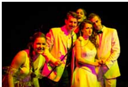
— Záběr z inscenace Taneční maraton na STEEL PIER