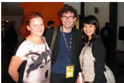
— Divadelní manažerky na konferenci — ENCATC