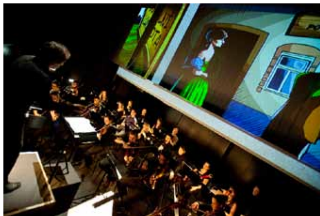
— Pohled na orchestr v inscenaci Prodaná nevěsta —

Libreto vycházející ze slavné divadelní hry přináší psychologicky dokonale propracovanou stavbu osudového telefonického rozhovoru ženy sklíčené pocitem osamocení. Drama podtržené