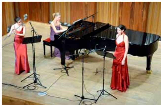
— Isha trio na festivalu „Leoš Janáček, life, work and contribution“ v Texasu