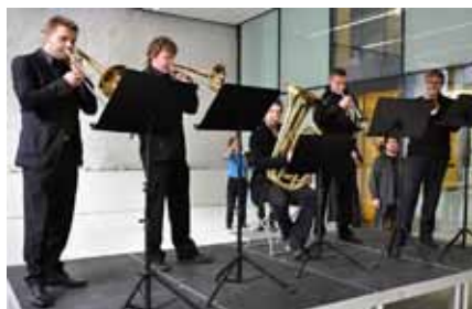
Žestové kvinteto studentů HF JAMU obstaralo prolog Slavnostního zahájení