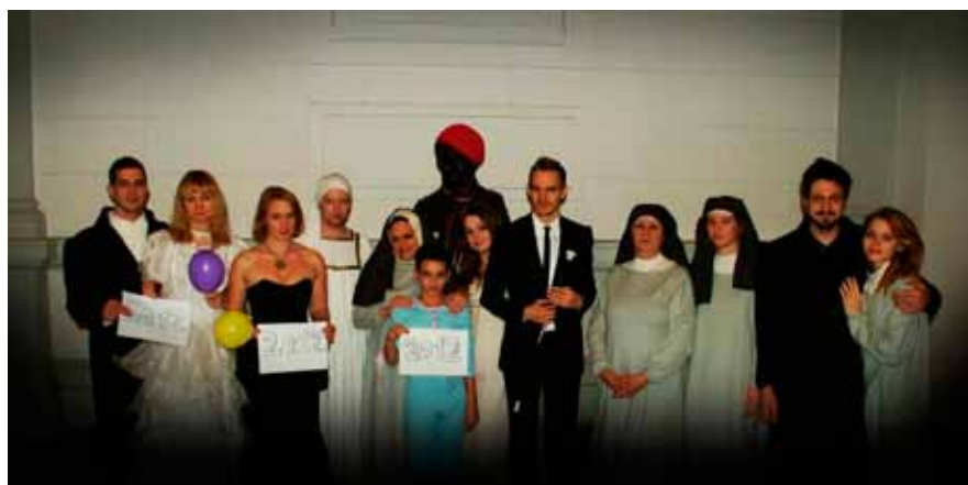
— Dne 12. 12. v 12 hodin 12 min. roku 2012 proběhlo zvláštní setkání hudebníků na schodišti HF JAMU —