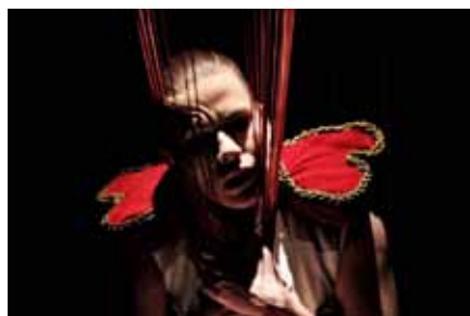
— Z inscenace Zpráva o svatém kárání