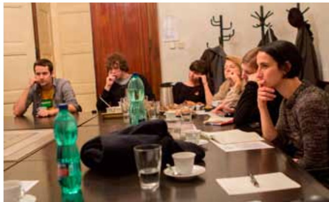
— Atmosféra malého mezinárodního setkání na DIFA JAMU —

a hájil svébytná práva „kinematografické fotogeničnosti“ a její disponovanost k onomu intermedialnímu překladu, jež konečně opouští „tezi o nesmyslné objektivnosti obrazu kamery“, a tak otvírá možnosti adekvátnějšího přístupu k daným otázkám. Závěrem pak konstatoval, že „divadelní záznam nelze totiž chápat jen jako útvar služebný divadelní heuristice či divadelnímu provozu, ale především jako samostatnou audiovizuální uměleckou tvorbu.“