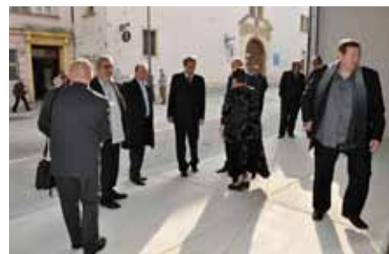
Vedení akademie se vítalo před novou budovou odpoledne s pozvanými hosty