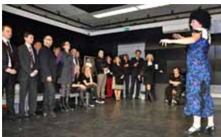
Skupinky hostů procházely odpoledne prostory nového divadla, kde je čekal speciální program