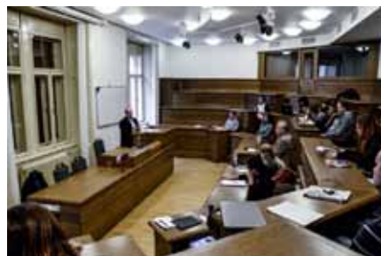
— Seminář s Hynkem Pekárkem —

Na již proběhlé aktivity navazují i v letním semestru akademického roku 2012/2013 workshopy, semináře a dílny s odborníky z praxe a umělecké projekty studentů DIFA JAMU. Mezi největší lákadla patří například workshop pro studenty