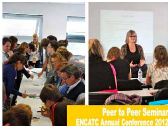
— Interaktivní „peer-to-peer“ seminář —

V pátek na tyto semináře tematicky navazovaly tzv. studijní návštěvy vybraných institucí. Například zájemci o kulturní diplomacii (navazování a vytváření styků se zahraničím skrz kulturu) mohli navštívit ústředí British Council, instituce, která propaguje britskou kulturu po celém světě (u nás je známá více jako pořadatel Cambridgeských jazykových zkoušek). Pro zájemce o výtvarné umění a muzejnictví byla zase určena návštěva populární