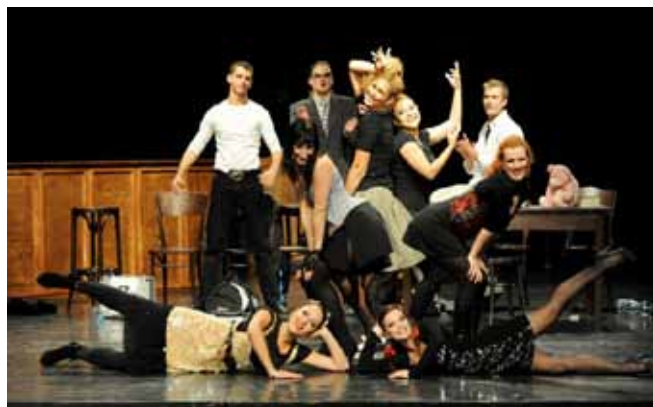
— Studenti 3. roč. muzikálového herectví v písňovém koncertu Líbej mě, líbej...