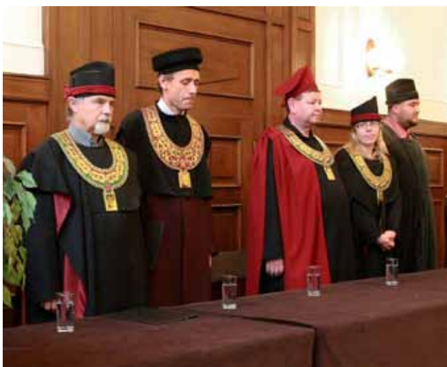
— Imatrikulace —