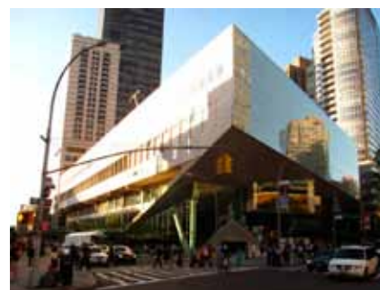
— Juilliard School – pohled z Lincoln Center Plaza