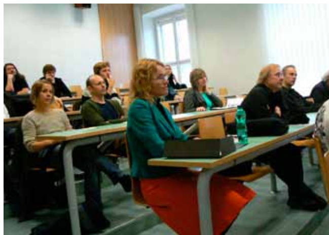
— Účastníci konference Musica Nova