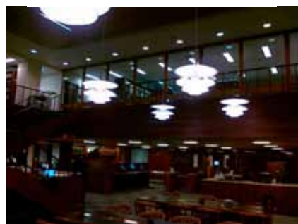
— Juilliard School – knihovna, foto: Richard Pohl