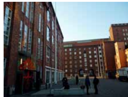
— Finská akademie umění — Kuvataideakatemia