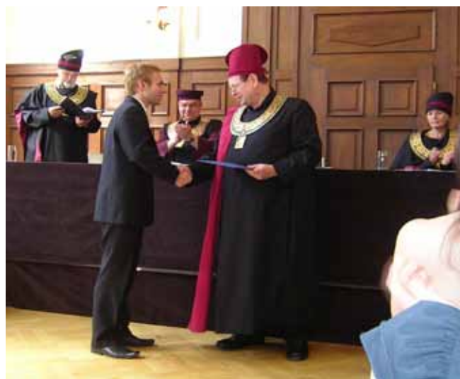
— Promoce, foto: Igor Alstern —