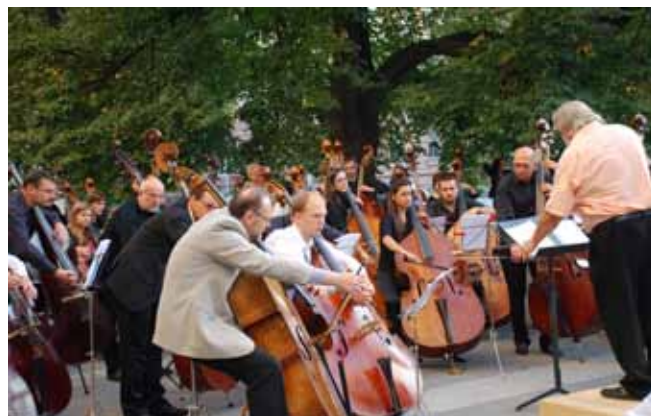
— Open Air koncert před budovou HF JAMU