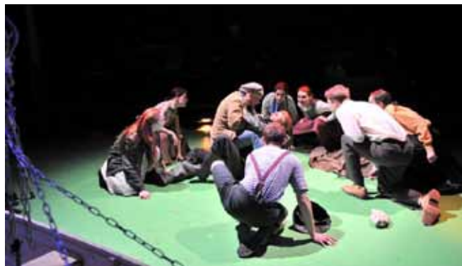
— Studenti 4. roč. činoherního herectví v inscenaci Mrzák inishmaanský