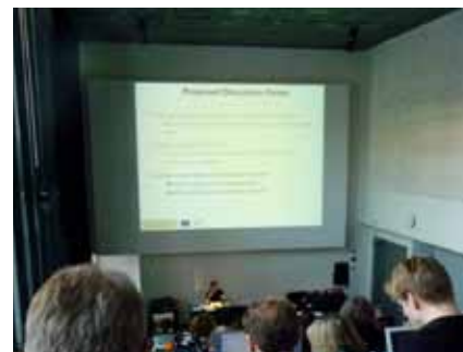
— Posluchárna s probíhající přednáškou, foto: Marek Hlavica