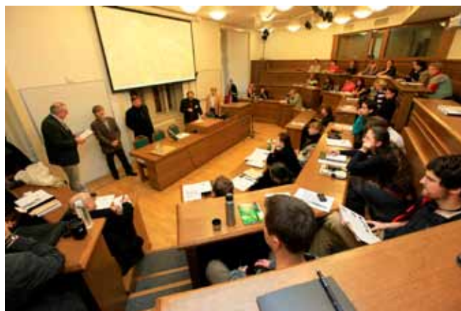
— Účastníci konference doktorských studií, DIFA 2011, foto: Petr Francán