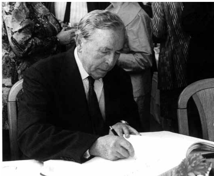
— Rudolf Firkušný při udělení čestného doktorátu JAMU v r. 1993, foto: Jef Kratochvíl

Metropolitan Opera House (tajný sen každého pěvce) a v eposlední řadě též legendární Juilliard School, patřící k nejprestižnějším světovým uměleckým univerzitám.