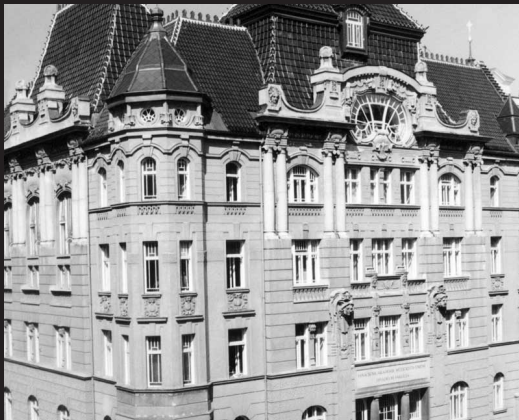
Divadelní fakulta JAMU